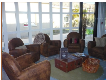
Vue intérieure du salon d'agrément du Pavillon Madeleine